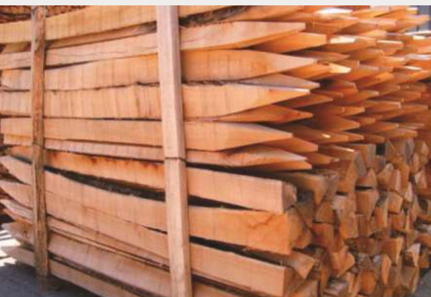
Serrados a dos caras.