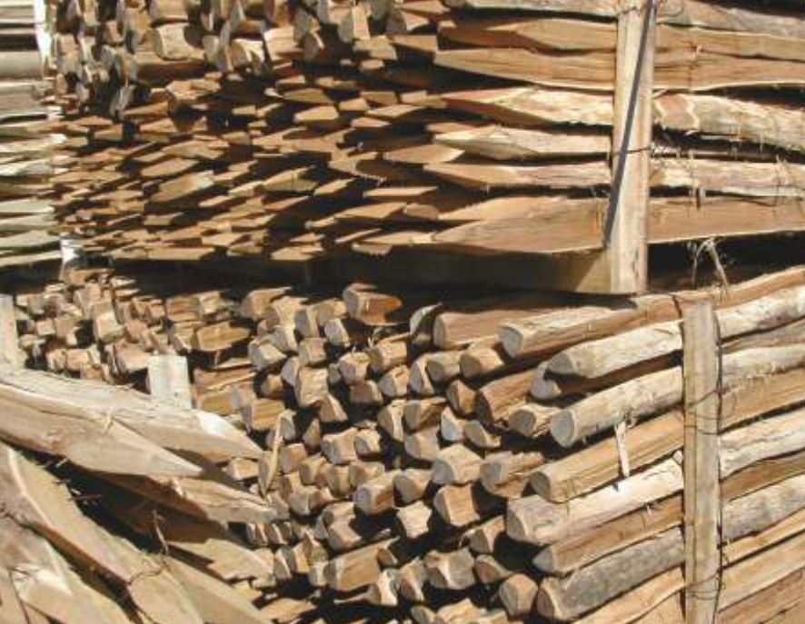
Abiertos "al hilo".