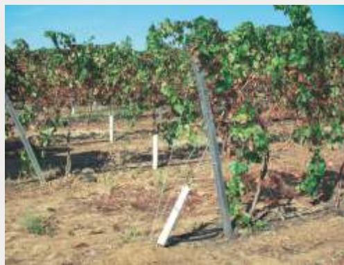
Piquetes de acácia