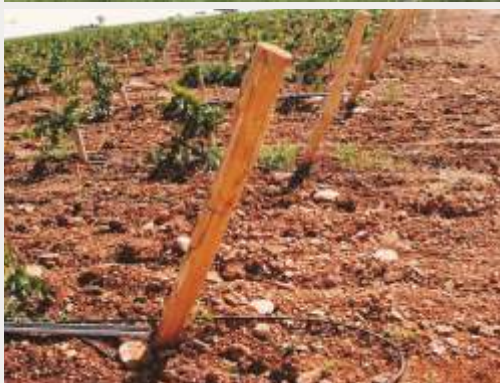
Colunas de acácia