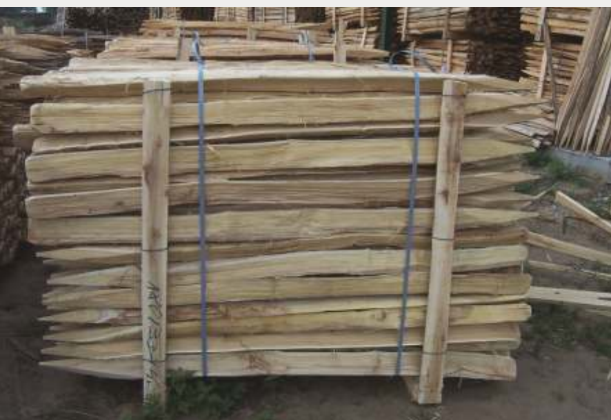
Abiertos "al hilo".